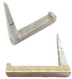
Grapa a asociar

Permiten la fijación de conductores planos de anchura 30 mm en paredes de hormigón o de ladrillo instalándolas en las clavijas de poliamida.