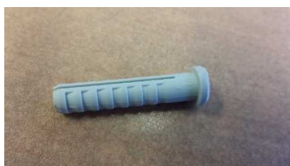
Ejemplo de instalación